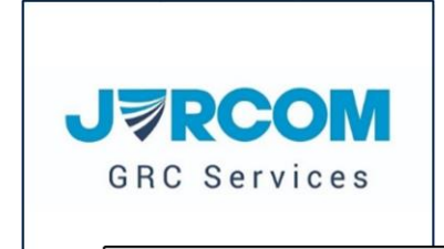
Jurcom GRC Services